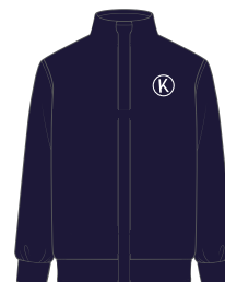
(Niñ@s) Sudadera deportiva de cierre lisa *También se puede usar en el uniforme de diario