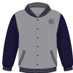
(Niñ@s) Chamarra Institucional *También se puede usar en el uniforme de deportes