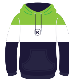
Sudadera Institucional *También se puede usar con el uniforme de diario.