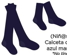
(Niñ@s) Calceta color azul marino *No tines