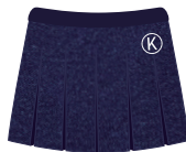
*Opcional (Niñas) Falda Institucional *Maternal no lleva falda