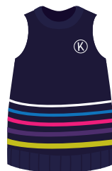
*Opcional (Niñ@s) Chaleco Institucional *También se puede usar en el uniforme de deportes