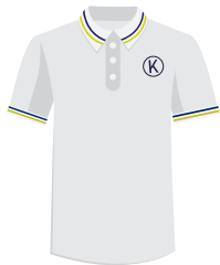
(Niñ@s) Playera polo Institucional