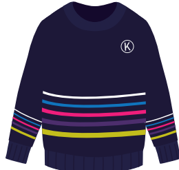
(Niñ@s) Suéter Institucional *También se puede usar en el uniforme de deportes