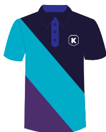
Playera polo Institucional