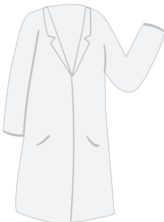
Bata blanca únicamente para ingresar al laboratorio *Marca libre

*También se puede usar en el uniforme de deportes.