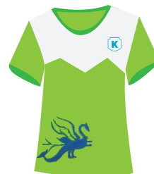
Playera deportiva Institucional