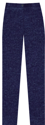
Pantalón de mezclilla color azul marino *Marca libre, sin estampados, decoloraciones o roturas