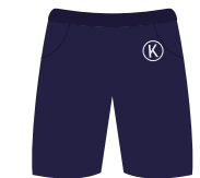
(Niñ@s) Pants o short color azul marino Institucional