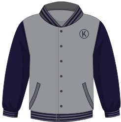
(Niñ@s) Chamarra Institucional *También se puede usar en el uniforme de deportes