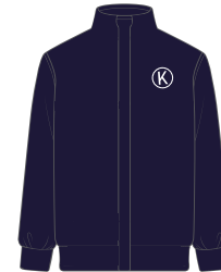
(Niñ@s) Sudadera deportiva de cierre lisa *También se puede usar en el uniforme de diario