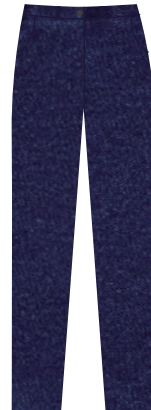
(Niñ@s) Pantalón de mezclilla color azul marino *Marca libre, sin estampados, decoloraciones o roturas