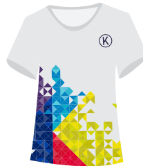
(Niñ@s) Playera deportiva Institucional