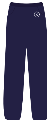
(Niñ@s) Pants o short color azul marino Institucional