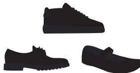
(Niñ@s) Zapato escolar o tenis color negro *Diseño libre