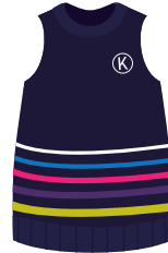
*Opcional (Niñ@s) Chaleco Institucional *También se puede usar en el uniforme de deportes