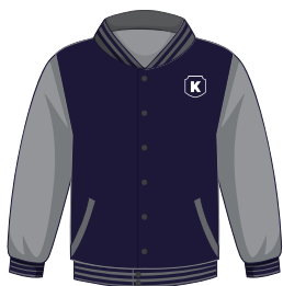
*Opcional Chamarra Institucional

*También se puede usar en el uniforme de deportes.