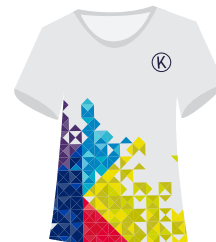
(Niñ@s) Playera deportiva Institucional